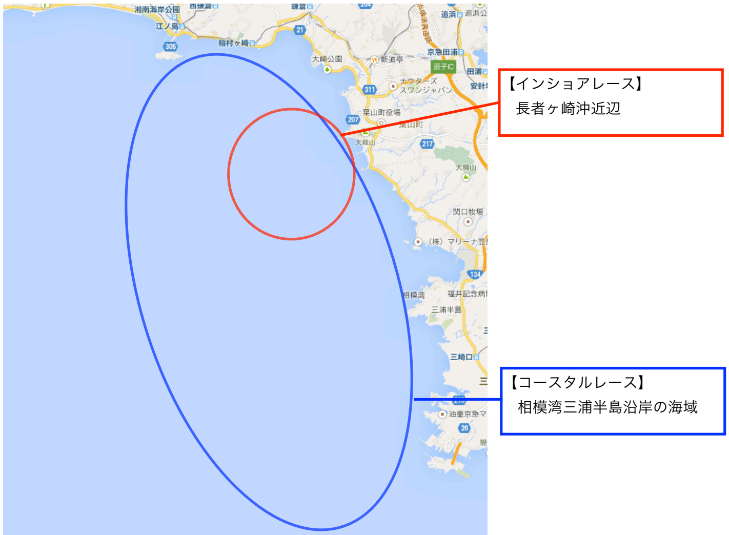
【レースエリアのおおよその位置】 図 A